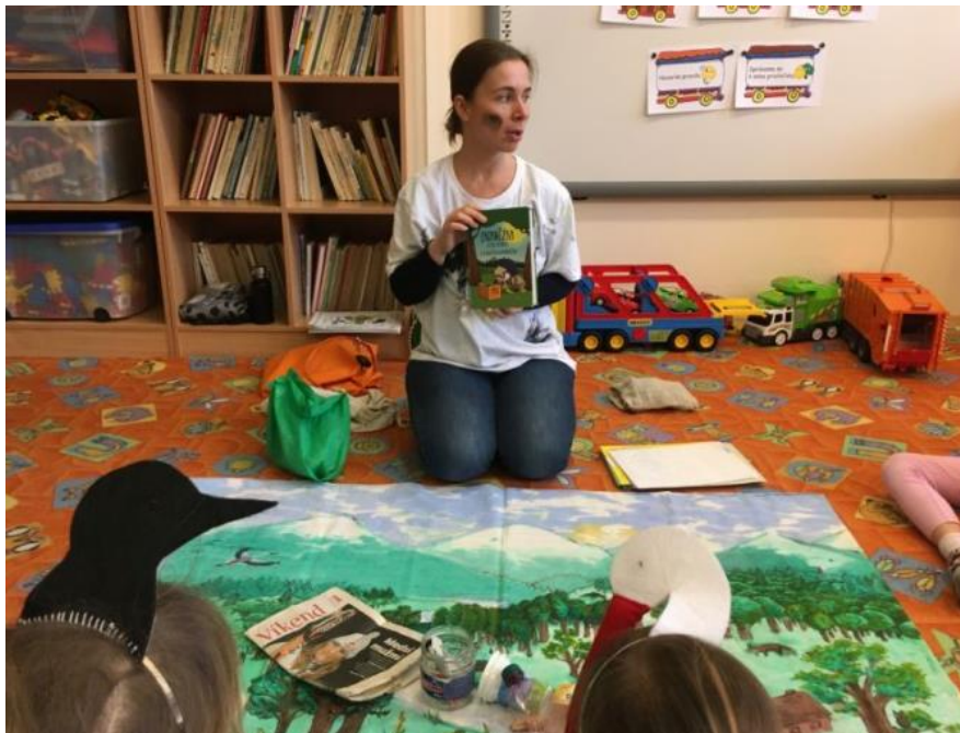
Lektori z DAPHNE priblížia, z čoho všetkého je zložená obyčajná batéria