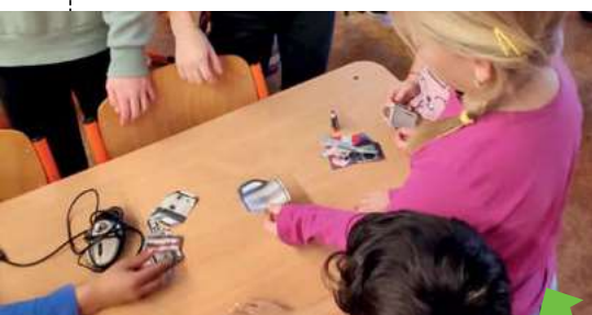
ZBIERANIE ELEKTROODPADU V ZÁKLADNEJ ŠKOLE GELNICA

Projekt bol spustený v roku 2014 a je určený pre všetky školy a vzdelávacie inštitúcie na celom Slovensku. V roku 2021 sa do projektu zapojilo 133 škôl, ktoré spolu vyzbierali takmer 96 ton elektroodpadu. To je oproti predchádzajúcemu roku 2020 takmer dvojnásobný nárast. Za vyzbieraný elektroodpad SEWA žiakov a študentov odmeňuje. Za zbery v roku 2021 SEWA odovzdala školám viac ako 820 kusov športových pomôcok. Cieľom projektu je naučiť mladých ľudí správne nakladať s elektroodpadom ekologicky priamo v praxi.