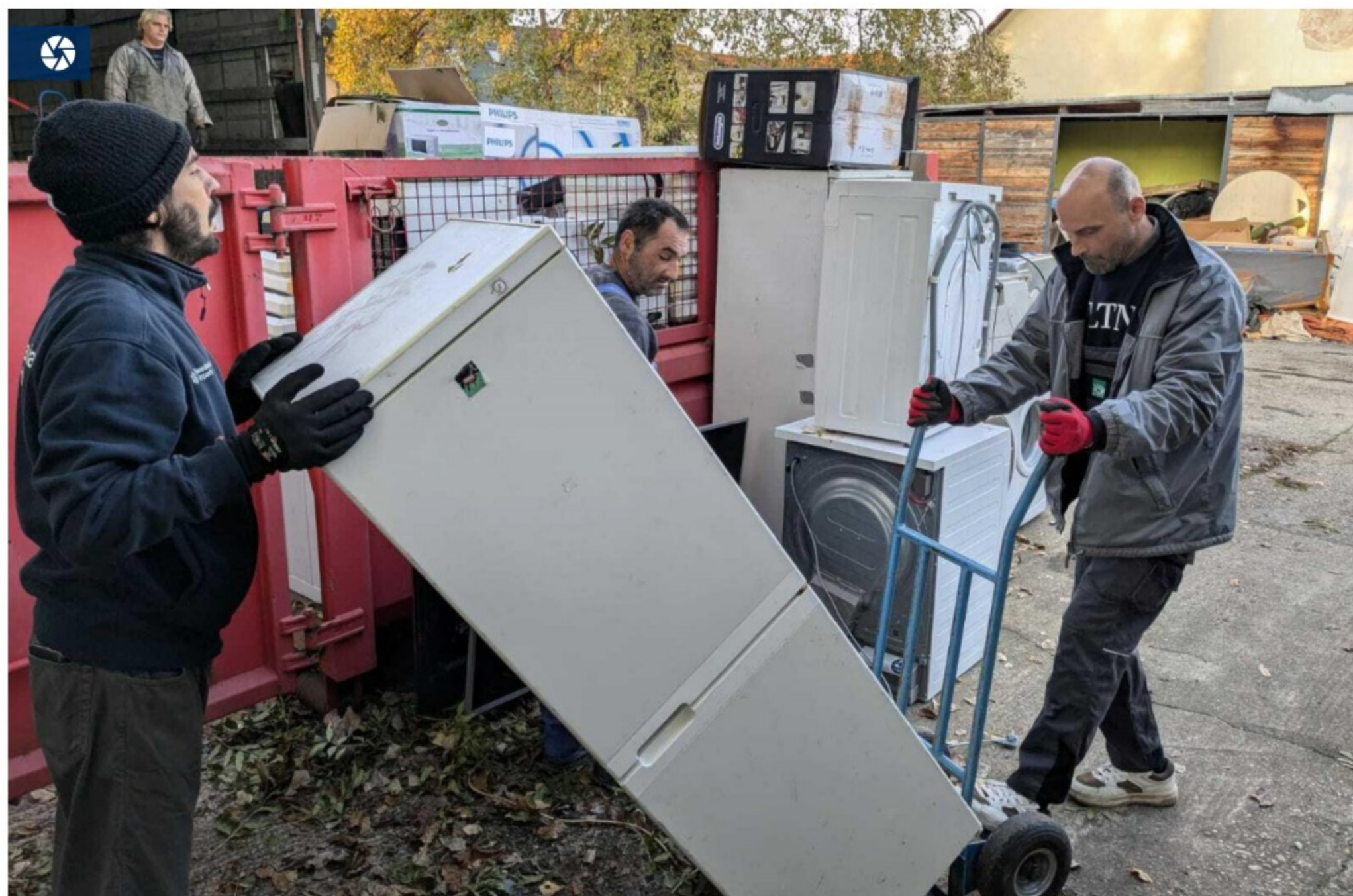
Projekt pracovnej rehabilitácie ľudí bez domova – zber elektroodpadu.